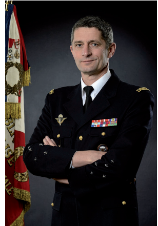
GÉNÉRAL D'ARMÉE DENIS FAVIER DIRECTEUR GÉNÉRAL DE LA GENDARMERIE NATIONALE

La prévention est un outil majeur de la gendarmerie face à cette menace. Elle est ciblée sur les personnes les plus vulnérables et notamment les mineurs. Face à la diversité des menaces, les actions de sensibilisation doivent appréhender l'ensemble du spectre de cette nouvelle délinquance afin d'être efficaces. Créées en 1997, 43 brigades de prévention de la délinquance juvénile (BPDJ) déployées sur l'ensemble du territoire sont chargées de mettre en œuvre des actions de prévention auprès des mineurs au sein des établissements scolaires. Face à l'accroissement de la cyberdélinquance, ces unités effectuent depuis déjà de nombreuses années des séances de sensibilisation aux dangers d'Internet. L'engagement de la gendarmerie dans l'opération Permis Internet pour les enfants conforte sa position d'acteur majeur dans la lutte contre la cyberdélinquance, et confirme sa présence sur tout le spectre de la cybermenace.